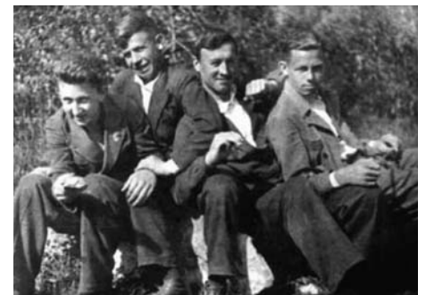
Групповое фото будущих подольских курсантов после окончания средней школы.

«Калужская медицинская газета» также неоднократно писала о подвиге военных медиков, буднях военных госпиталей, развёрнутых на территории Калужской области, послевоенном тяжёлом труде по восстановлению всей страны и медицины, в частности. В год 75-летия Великой Победы мы с благодарностью и уважением к памяти огромного подвига продолжаем рассказывать о том, что происходило на калужской земле почти 80 лет назад.