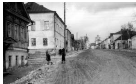
Калуга после захвата гитлеровскими войсками.

В центре много целых, но замороженных домов без стекол. Один понравился. Вывеска: «Педагогический институт». Завернули. Стёкла выбиты, но не горел. Казарма что ли была? На стенах нарисованы забавные картинки – жрут, пируют и похабщина. По углам валяются бутылки из-под вин. Посмотрел – французские. В нескольких комнатах выломаны полы – видны щепки, видимо, рубили на топливо. Груды тряпья, русские деревенские одеяла из лоскутов, дерюги. Кутались. Мебели не видно – всё сожгли.