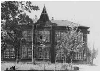
Кировская районная больница в годы Великой Отечественной войны.