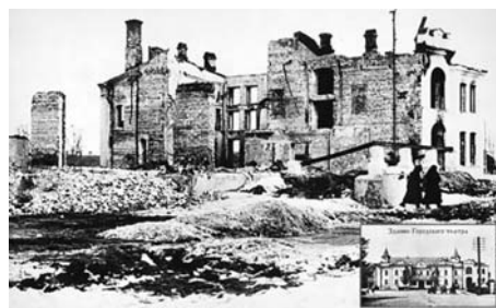
Занятие городского театра.

защищавшая Калугу, оборонялась стойко и, лишь оказавшись почти в окружении, вышла из него с боем, чтобы сохранить людей и вооружение для дальнейшей обороны, прежде всего – Москвы. После ожесточенных боёв Калугу сдали. Время входа немецких частей в город документы вермахта зафиксировали чётко: 12 октября 1941 года, в 21 час. Показавшиеся вечно несколько месяцев город находился в оккупации.