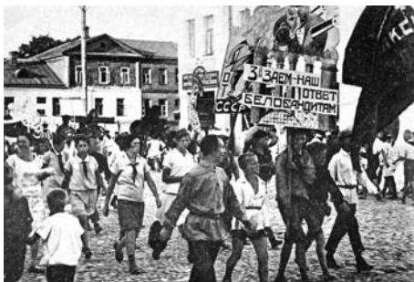
Калуга. Парад пионеров, 20-е годы.

Из Акта по установлению и расследованию злодеяний немецко-фашистских захватчиков и их сообщников и причиненного ими ущерба гражданам, общественным организациям, государственным предприятиям г.Калуга: