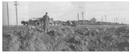
1941 год. Воронка от немецкой бомбы и разрушенный железнодорожный состав, предположительно, в районе Тихоновой пустыни.

ные, старались помочь младшим, вдохновить личным примером.