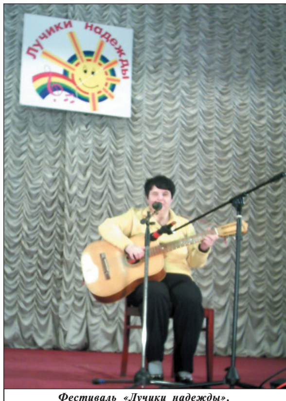
Фестиваль «Лучики надежды».

ного развития. Приходится совершенствоваться, изучать научную литературу, следить за последними технологиями и методиками в медицине, а потом делиться знаниями с пациентами».