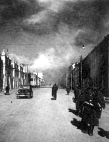
Калуга. Немецкая фотосъёмка 12 октября 1941 г. Современная улица Ленина.

Вот представьте, обслуживаем большую территорию. Выезжаем на травмы, несчастные случаи. А если с криминалом связано, то милицию, да всё оформление ждётся, иногда и час, и два пройдёт. А у кого-то инсульт или инфаркт, у ребёнка приступ крупы - человек погибнуть может. Вот и ругают все. Пришлось поднимать вопрос, чтобы лечебные учреждения на дежурства выдавали нам ещё дежурца с терапевтом. Но это появилось только где-то в 63-64-м годах. Тогда же появились первые специализированные бригады, например, педиатрические. До 63-64-го годов в машинах была белая, что не описать. Находились там, где сейчас Дом художников. Всего 3 комнаты. Помещение раннее принадлежало купцу какому-то, где он хранил крупу, рогожу и медик: в белах палатах, халатах, спарсят людей. Казалось, будто из другого мира они, где все светло, чисто и милосердно. А вообще-то мой отец был с медией связан, работал в учреждении здравоохранения. Стар-